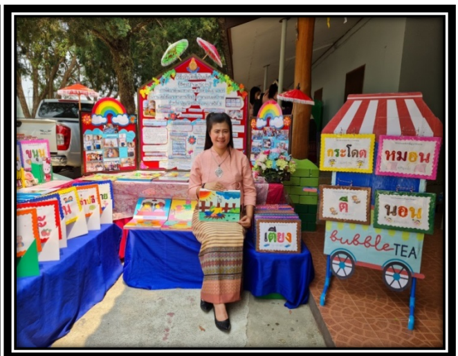
การเผยแพร่ผลงาน