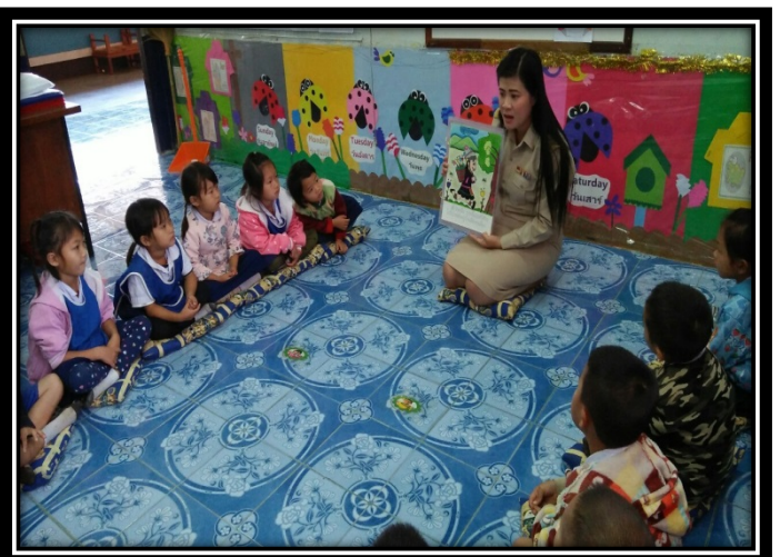
ครูเล่านิทานให้นักเรียนฟัง