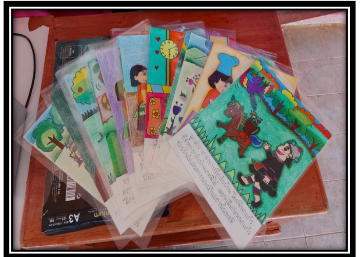
ขั้นตอนการวางแผนและเตรียมการและออกแบบ/สร้างนิทานคำพื้นฐานอนุบาล