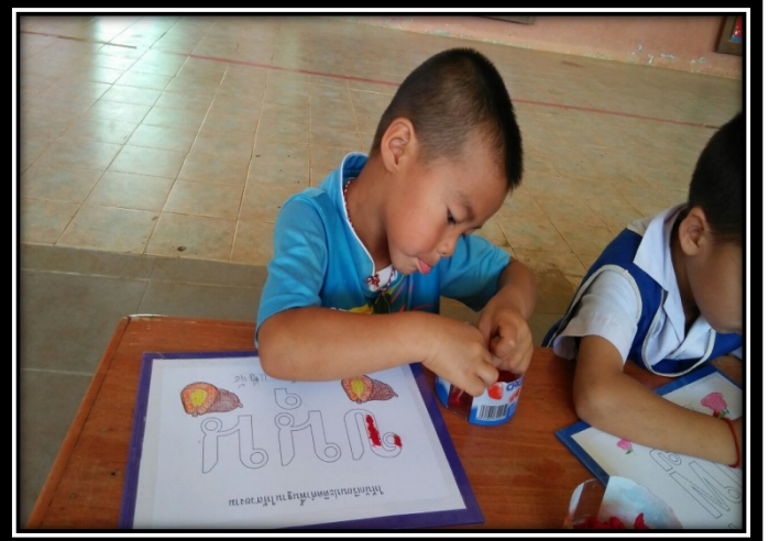
นักเรียนสร้างสรรค์ผลงานคำพื้นฐานด้วยเปเปอร์มาเช่