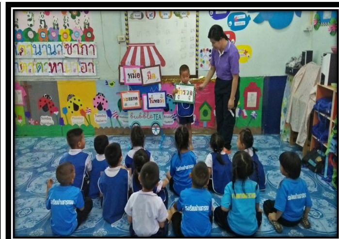
ทบทวนและฝึกความแม่นยำ